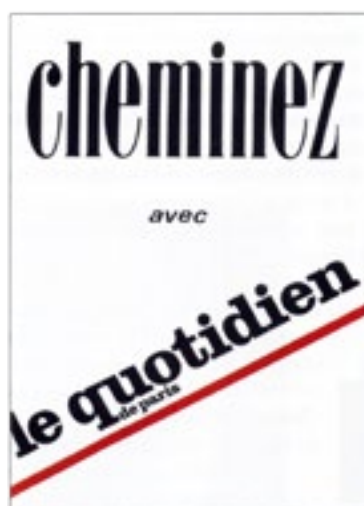
▲ Pour sa publicité, le Quotidien de Paris a repris le logo de la revue Cheminées Magazine.

Récompensées dès l'origine par de nombreux prix (Coupe d'Or du Bon Goût Français, Diplôme du Prestige de la France, Médaille de Vermeil de la Ville de Paris, Médaille d'Or de l'Académie des Arts,