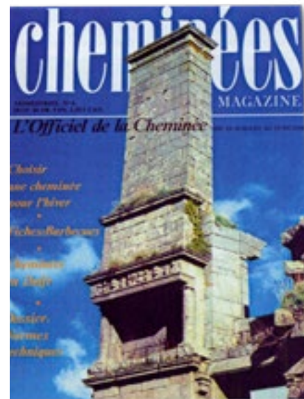
▼ Le château s'est effondré, seule la cheminée a résisté... (n°6)