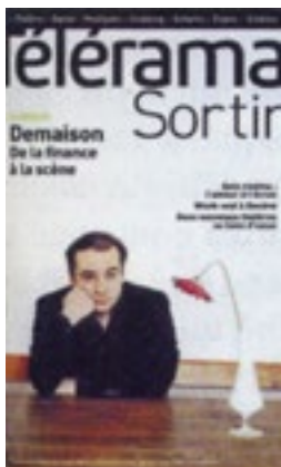
▲ Allusion amicale de François-Xavier Demaison à Cheminées Magazine, dans Télérama...

nom de Cheminées Magazine : Cheminées de France (« Si c'est ton credo ; j'appliqu'rai les lois d'la finance ; je f'rai d'la rando ; j'm'abonn'rai à Cheminées de France... ») et que l'humoriste François-Xavier Demaison, dans une interview à Télérama, raconte avec malice ses débuts :